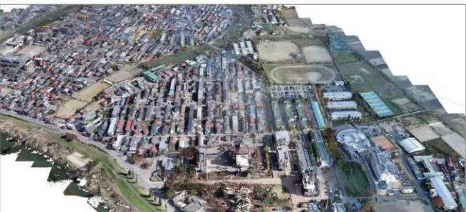
ドローンで撮影したキャンパスとその周辺の立体画像

以上の背景から、本シンポジウムでは被災から1年経ったことを受け、これまでの研究成果を市民や学生の皆様に広く報告させていただく機会を設けることといたしました。なお、新型コロナウイルスの感染拡大防止のため、ウェビナー(WEBセミナー)形式での開催といたしますが、ネットワーク環境の整っていない方々に対しては、人数制限を設け、来場いただくことも可としますので事前にお申し込みくださいますようお願いいたします。