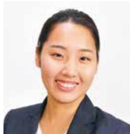
オリンピックメダリスト 三井梨紗子さん