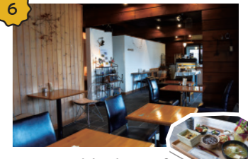
shizuku cafe 木目調の落ち着いた店内で提供されるのは、おこわとお餅の料理。数量限定のお餅ランチや自家製のお米や野菜も人気です。