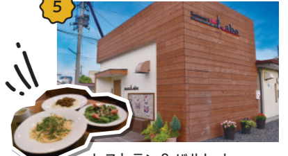
レストラン&バルLabo 隠れ家的レストラン。バルスタイルの店内で、極上のイタリアンをいただきながら、ほっとひと息。ランチも楽しめます。