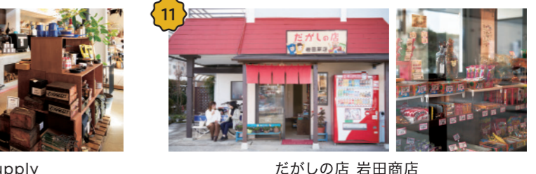
だがしの店 岩田商店 懐かしいお菓子、ほっこりする店の雰囲気の中、迎えてくれるおばあちゃんに優しく、つい長居を。