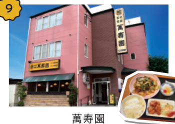
萬寿園 ランチから夜ご飯、宴会まで地元幅広く愛されている和テイストの「町中華」。ご飯お代わりサービスありで、学生におすすめです。