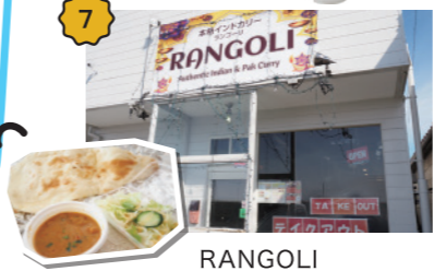
RANGOLI 本格インド&パキスタンカレーに舌鼓♪種類いろいろ、辛いいろいろ。テイクアウトや学生向けのセットもあります。