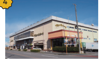
アミューズパーク郡山 バッティングセンター、ボウリング場、釣り堀、クレーンゲーム、猫カフェなどが大集合。スポーツと遊び満載です！