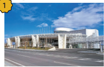
ビッグパレットふくしま 会議やイベント、展示会など、さまざまな催し物に使われる複合コンベンション施設。楕円形の大屋根の外観が印象的です。