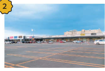
イオンタウン郡山 洋服も食品も雑貨も、必要なものが揃います。飲食店もたくさんあるので、友だちとのぶらり休日をごすのりも。