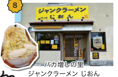
バカ増しの里 ジャンクラーメン じおん ボリュームに驚き、美味しさにさらに驚き、麺も野菜も肉も残さず、スープも飲み干して胃袋は大満足。美味しさ要注意のラーメン！