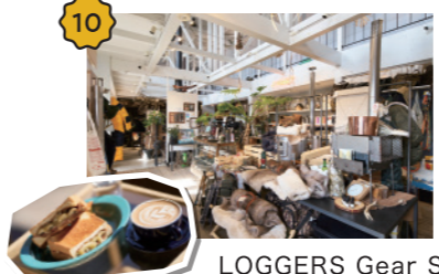
LOGGERS Gear Supply アウトドア派に人気のキャンプ用品とカフェのお店。オシャレで実用性が高いキャンプグッズが揃い、2階でカフェや軽食が楽しめます。