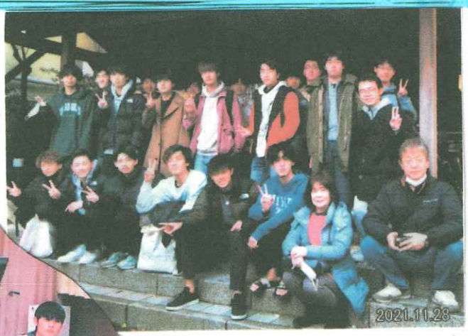
12月 忘年会 温泉旅館で1泊