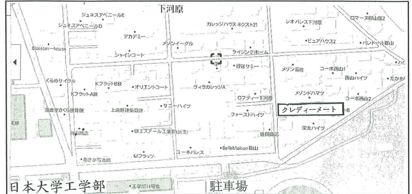
日本大学工学部 駐車場の様子