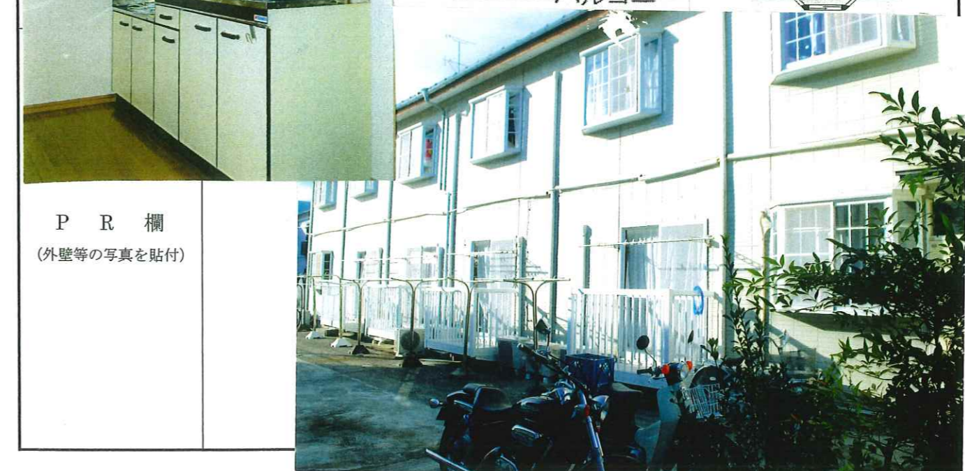
PR欄 (外壁等の写真を貼付)